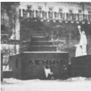
Первый «мавзолей» на Красной Площади

Первый «мавзолей», сколоченный за неделю, представлял собой усеченную ступенчатую пирамиду, к которой с двух сторон примыкали Г-образные пристройки с лестницами. Посетители спускались по правой лестнице, обходили саркофаг с трех сторон и выходили по левой лестнице. Через два месяца временный Мавзолей был закрыт, и началось строительство нового деревянного Мавзолея, которое продлилось с марта по август 1924 года.