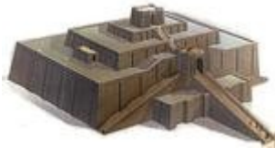
зиккурат в Уре (Месопотамия)