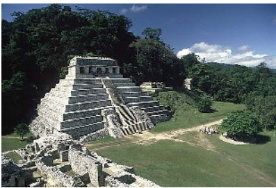
ступенчатая пирамида майя